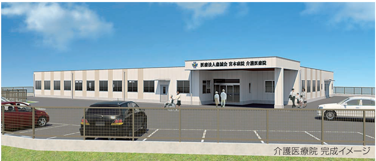
介護医療院 完成イメージ