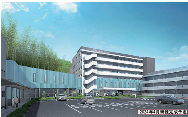
中央棟 完成イメージ