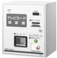
テレビカード (おもいやりカード) 精算機