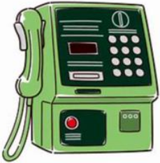
公衆電話 中央棟 1階