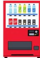
自動販売機 中央棟 4階 デイルーム