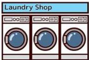
コインランドリー 中央棟 3階 南棟 2階 北棟 1階, 2階, 3階