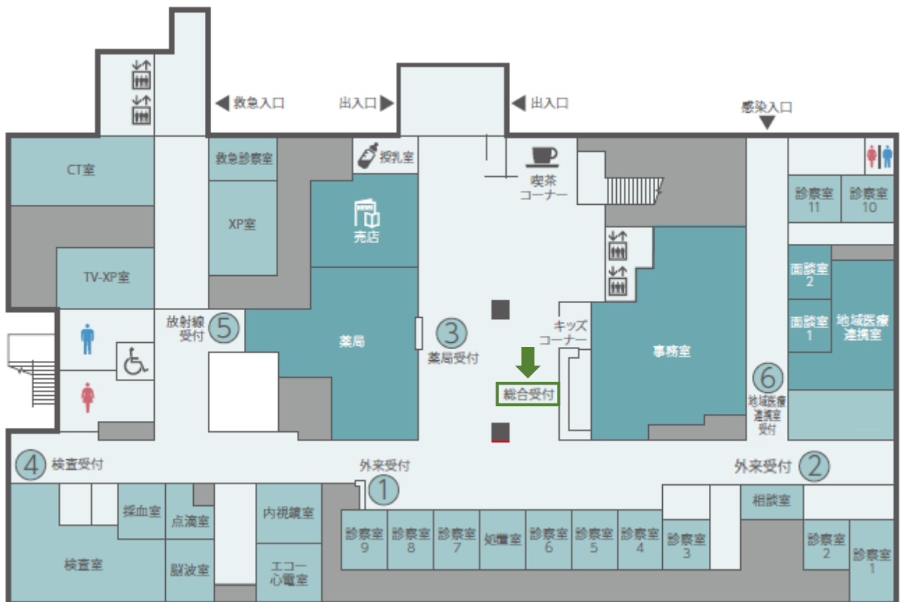
<中央棟1階フロアマップ>